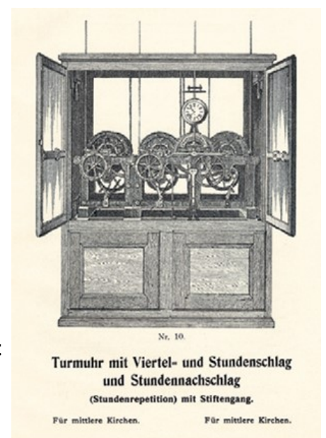
Zeichnung des damaligen Prospektes der Firma Mannhardt in München